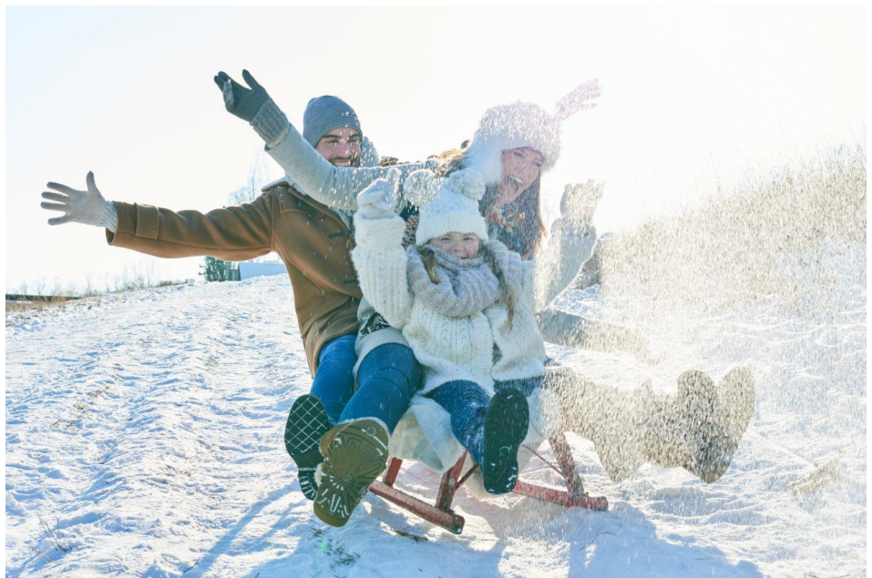
Die Familie ist für die Deutschen ein wichtiger Schlüssel zum Glück.

Saarbrücken – Gemeinsam Zeit verbringen, sich gegenseitig unterstützen und das möglichst lange – für die Mehrheit der Deutschen ist die Familie das größte Glück. In der aktuellen forsa-Umfrage „Familienglück“ im Auftrag von CosmosDirekt, dem Direktversicherer der Generali in Deutschland, sagen 93 Prozent, dass die Familie für das persönliche Glück (sehr) wichtig ist.